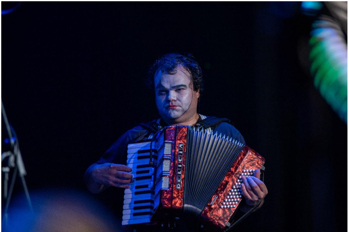
Koncert kapely Paní věší prádlo